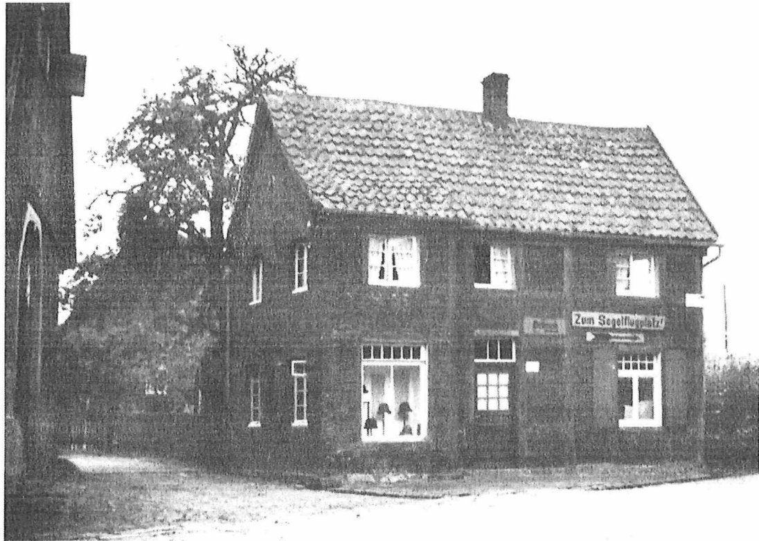
Abb.1 nördliche Traufe und östlicher Giebel

Alle konstruktiven Hölzer sind aus Eiche, der Belag ist aus Nadelholz